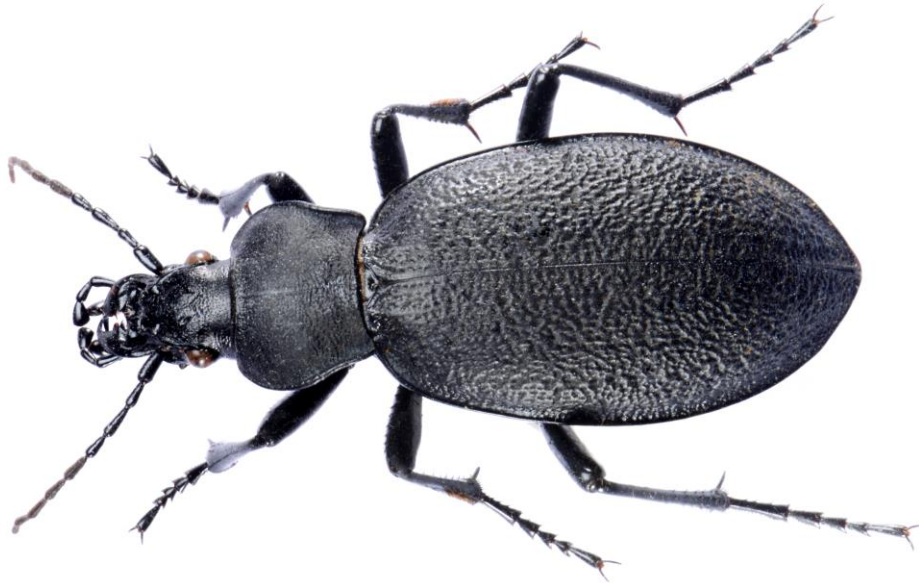
Lærløper Carabus coriaceus .