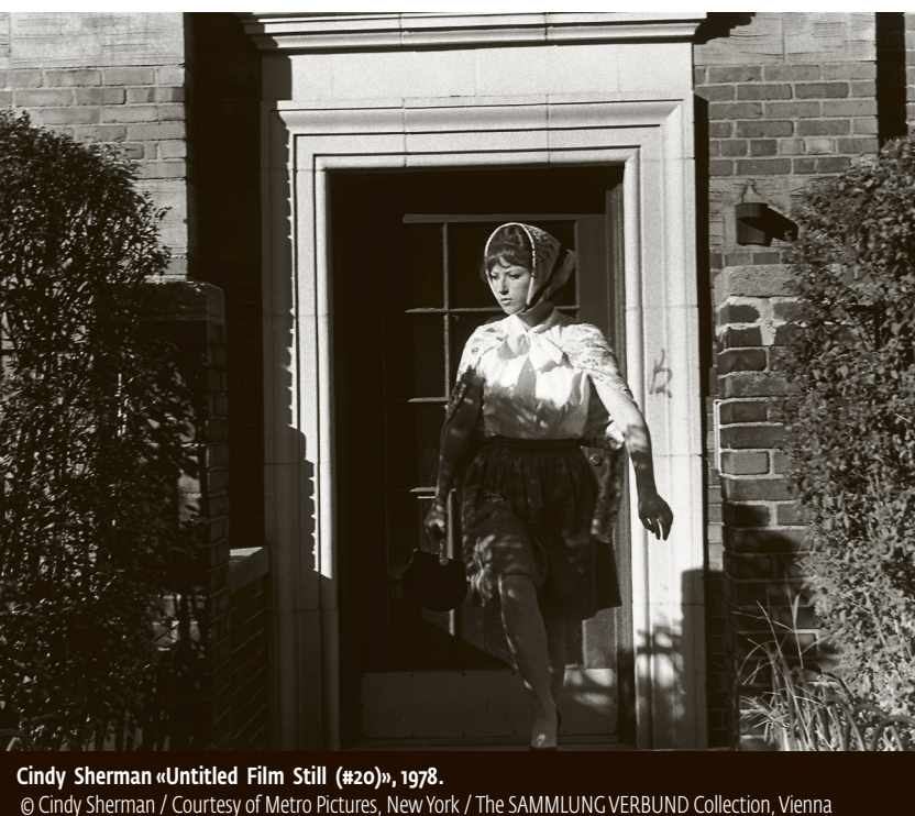
Cindy Sherman «Untitled Film Still (#20)», 1978.

«Engine» Kistefos-Museet 27. mai–7. oktober Filmar og måleri av den kjende polske målaren, teiknaren og filmskaparen Wilhelm Sasnal. Utstillinga gir eit breitt innblikk i produksjonen. Biletspråket er inspirert av popkunst. Motiva er flotte, men forenkla inn til beinet.