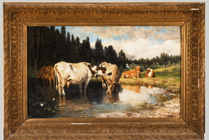
Christian Skredsvig: Kuer ved vanningsstedet

nasjonalromantikken. Kunstnaren spør kvifor så få av verka tek føre seg temaet utvandring, med tanke på kor mange nordmenn som emigrerte til USA. Kollasjane hennar er laga med utgangspunkt i måleriet «Utvandrere» av Gustav Wentzel (1902). Dette er eitt av svært få verk frå denne perioden som tok opp temaet emigrasjon.