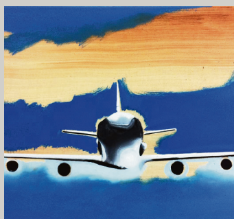
Wilhelm Sasnal, Utan tittel, 2016.

Christian Skredsvig frå den franske rivieraen, Grez, Caen, Roma og Sevilla. Storparten av bileta er lånte inn frå private eigarar og har ikkje vore stilte ut tidlegare. Samstundes kan du nytte høvet til å besøke den uvanleg vakre og