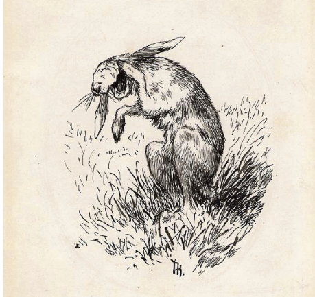
«Haren lo så kjeften sprakk», Theodor Kittelsen (1884). Nasjonalmuseet