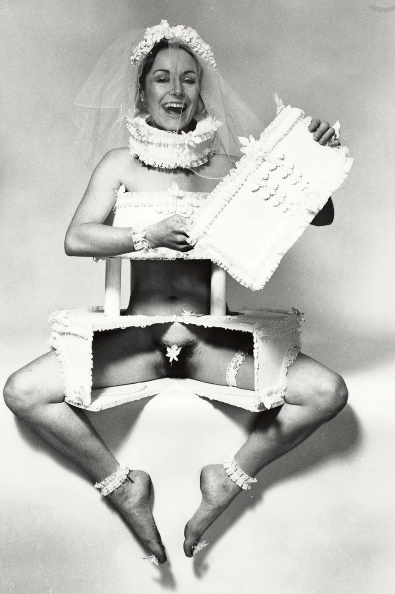
Penny Slinger, «Wedding Invitation – 2 (Art is Just a Piece of Cake)», 1973.

«The personal is political» Den amerikanske feministen Carol Hanisch