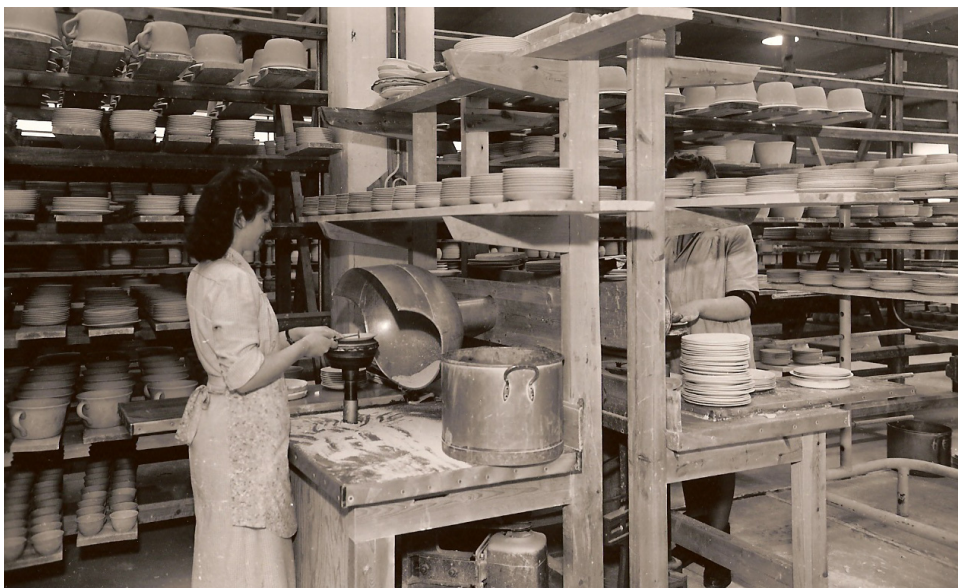
Arbeidsmiljøet ved Stavangerflint ble karakterisert som godt. Arbeidet var sjeldent tungt, men det kunne være ensformig. 60 % av de ansatte var kvinner.