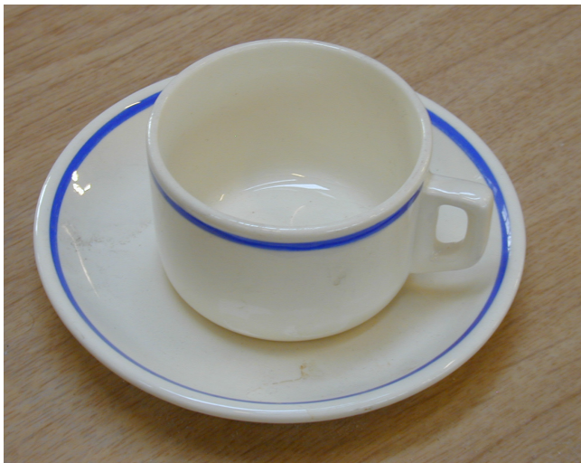
Stavanger Fajansefabrikks første dekor: Dekor 01, håndmalt blå linje, fra 1949. Koppen er modell Standard, stdr. 4.

lom Stavangerflint og Figgjo Fajanse. Først i 1979 ble det åpen konflikt. Det var da forslaget om å legge ned avdelingen i Hillevåg sto på dagsorden. Styret i foreningen reagerte med å legge ned sine