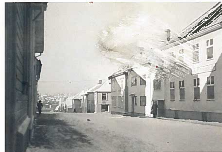
Breibakken sett mot Breiavatnet. Breibakken strekker seg fra Tårngaten ved Hetlandskirken og nedover til Kongsgaten ved Breiavannet. Den var opprinnelig oppkalt etter sistnevnte, men tidens endringer i skrivemåte har endt i Breibakken, et navn som for øvrig passer til gatens gode bredde. Kilde: Stavanger byleksikon. Wigestrands Forlag 2008.

Alle vennene mine hadde sykler, noen arvet fra eldre søsken, men de fleste hadde fått ny sykkel. De med gir var tøffest. De med speedwaystyre var heller ikke så verst. Hvis de hadde begge deler – både gir og speedwaystyre – da var de ganske overlegne.