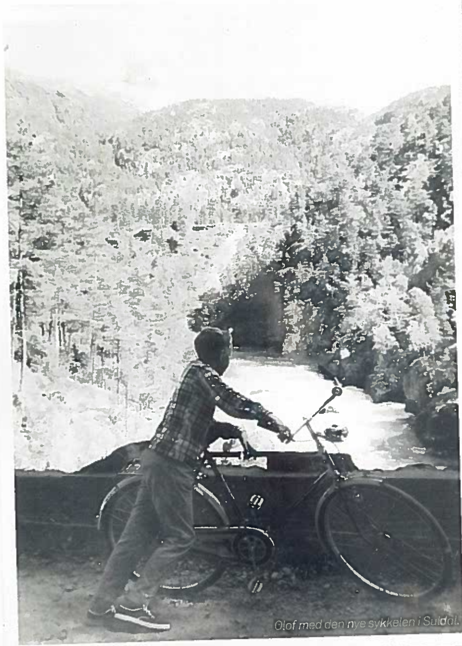
Olof med den nye sykkel i Suldal.