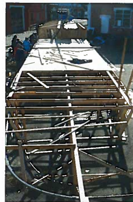
Fra byggingen av modellen av dampskipet D/S Sandnæs.