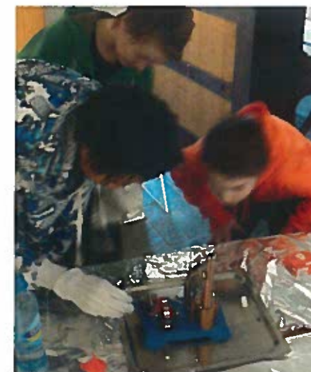
Elever fra Kannik skole gjør forsøk med hjelp av dampmaskin.

Elever fra Kannik skole om bord i Hundvaag 1, på vei til Tou Scene.