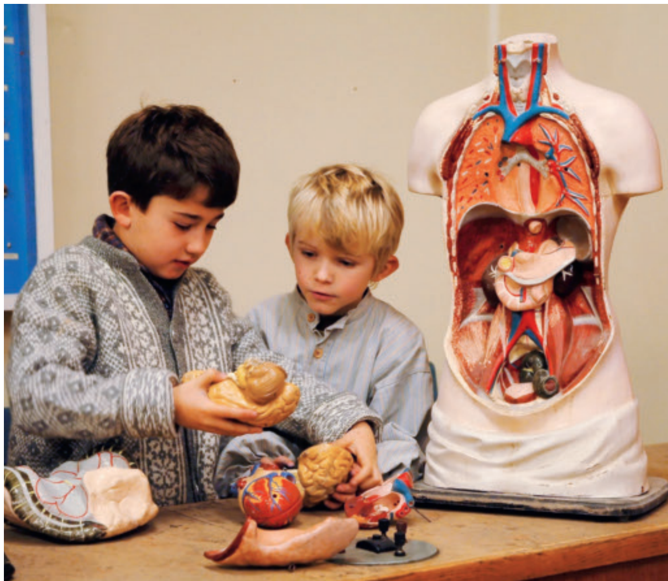
Stavanger skolemuseum (tidl. Vestlandske skolemuseum) ble etablert i 1825. Museet holder til i Hillevåg i gamle Kvaleberg skole.