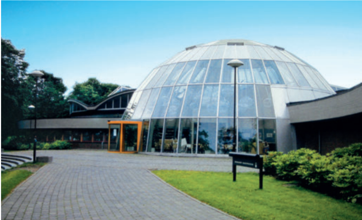
Stavanger kunstmuseum (tidl. Rogaland kunstmuseum) ble under navnet Stavanger Faste Galleri etablert i 1866. Museet holder til i Mosvannsparken i eget bygg fra 1992.