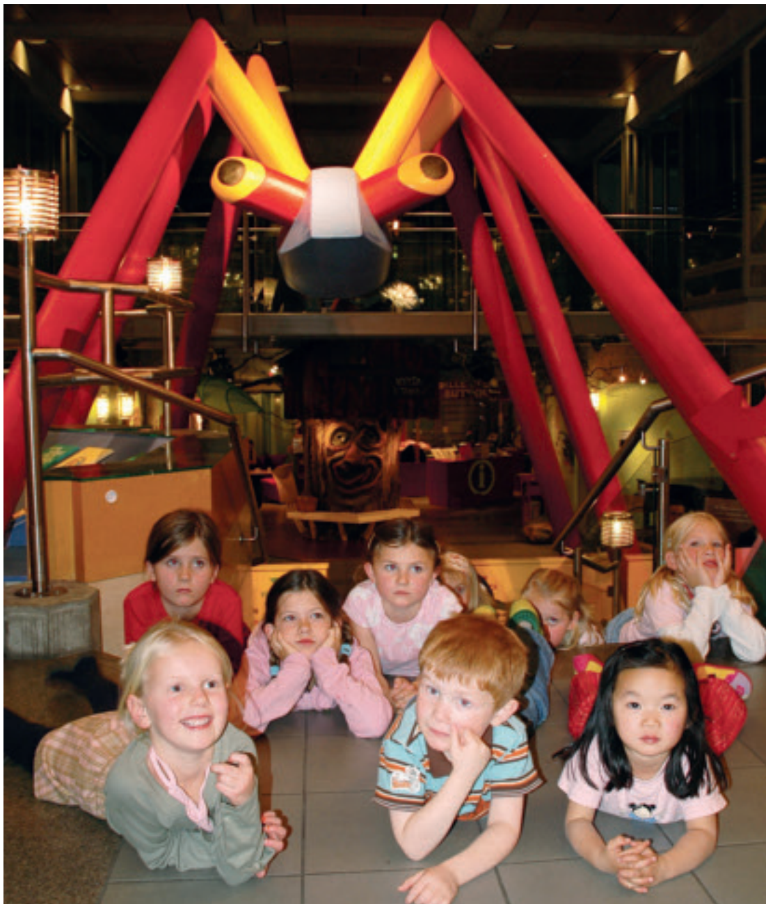
Norsk Barnmuseum ble etablert i 2000. Museet har nettopp flyttet fra Stavanger kulturhus Sølvberget til Stavanger museum hvor nye utstillinger er under utvikling.