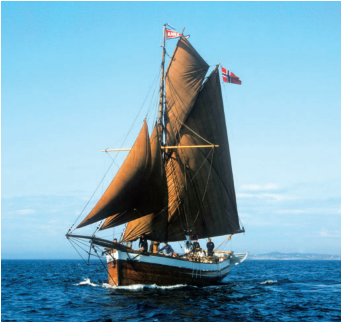
Anna af Sand er en hardangerjakt fra 1854