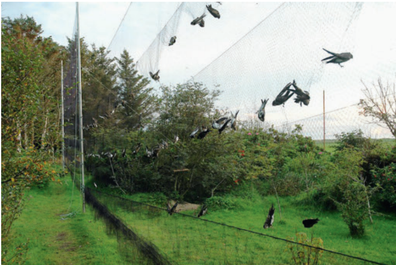
Revtangen ornitologiske stasjon etablert i 1937.

I 2009 bevilget Staten 2 millioner kroner ekstra til drift av den nye museumsenheten. Dette ble fulgt opp av Stavanger kommune og Rogaland fylkeskommune. Samlet ble det gitt en volumøkning av de offentlige tilskuddene på kr. 4.884.000 i forbindelse med denne konsolideringen.