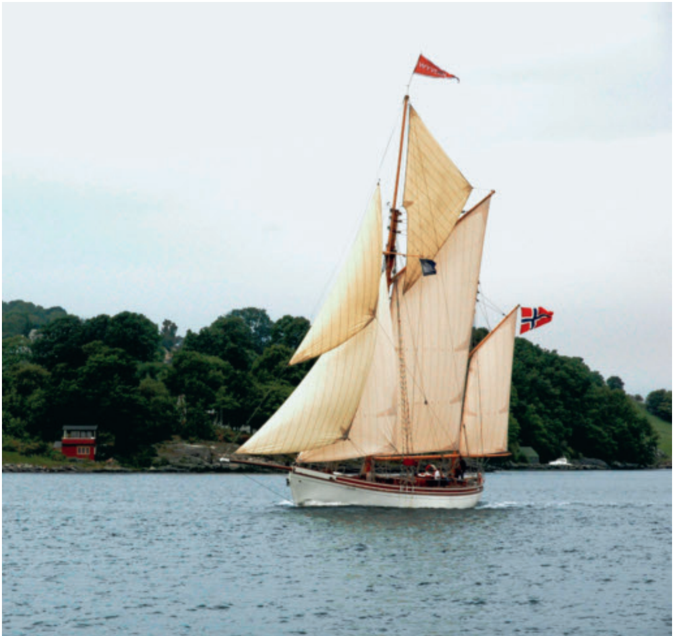
Wyvern er bygd i 1897, konstruert av Colin Archer.