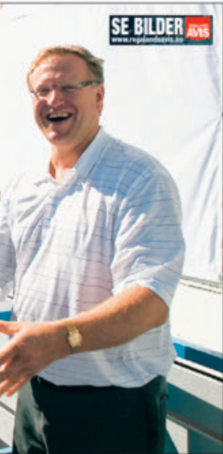
Sammenkomsten av Stavanger Museum og Rogaland Kunstmuseum.