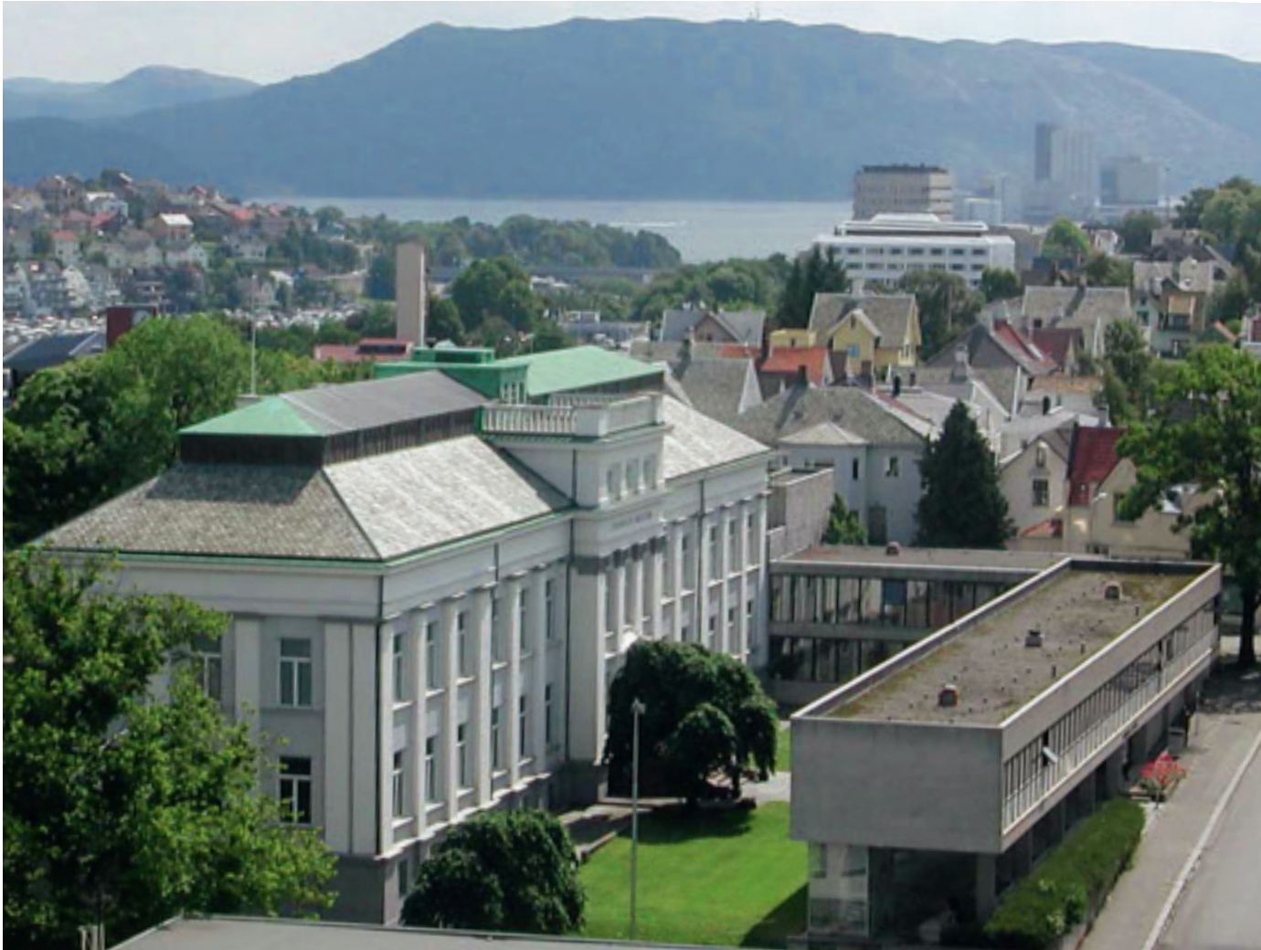
Stavanger Museum ble etablert i 1877. Museumsanlegget i Muségaten 16 er bygd i 1893, 1930 og 1964.