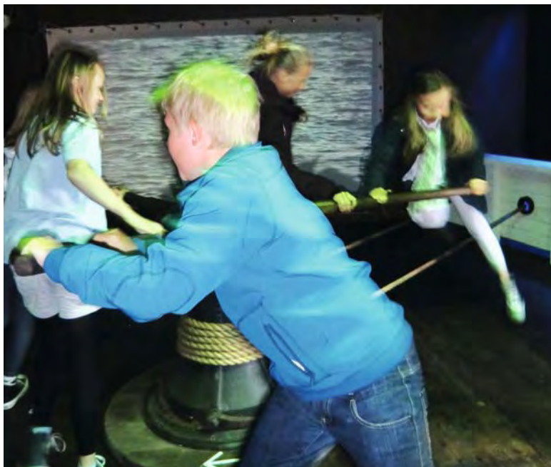
Elever fra Gausel skole i "Niels Waldemars reise – sjøens menn, mus og mat i 1898"

Erfaringene fra utstillingen "Niels Waldemars reise – sjøens menn, mus og mat i 1898" vil også være viktige for den videre utviklingen av Sjøfartsmuseets formidlingsprogram. Museet har startet arbeidet med fornying av eksisterende utstillinger og utvidelse av museumsanlegget i Nedre Strandgate. Målet er å tilby flere nye og engasjerende utstillinger i de kommende årene.