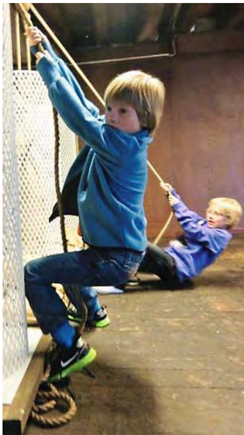
Matematikk i praksis: Elever fra Sunde skole beregner vekt ved hjelp av blokker og taljer.