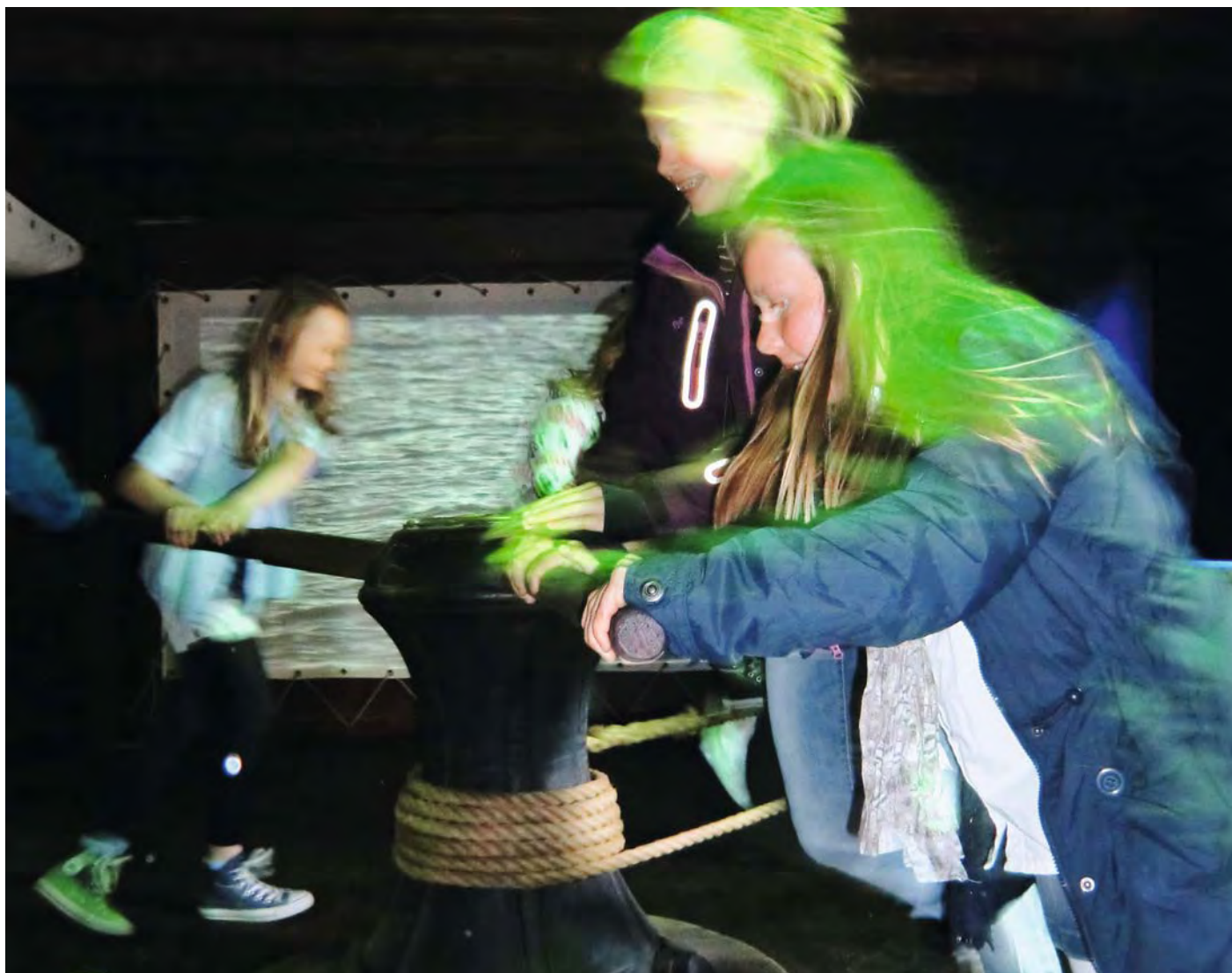
Elever fra Gausel skole hever ankeret.