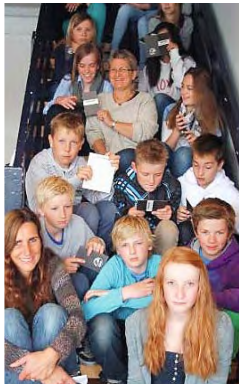
Elever fra Lassa skole 7A sitter i gangveien og venter på vinden.

Utstillingen vises i et urehabilert sjøhus som er svært lavt under taket, og som fortsatt har mange "knær" bevart i bygningskonstruksjonen. Det er litt rått og trekkfullt der, og illusjonen om at vi befinner oss under dekk på en seilskute er dermed lett å skape. Arealet på cirka 200 kvadratmeter er inndelt i flere rom og soner, med miljøer for ulike aktiviteter. Rommet er utrustet som et skipsdekk, og har i tillegg et seilmakerverksted fullt utrustet med