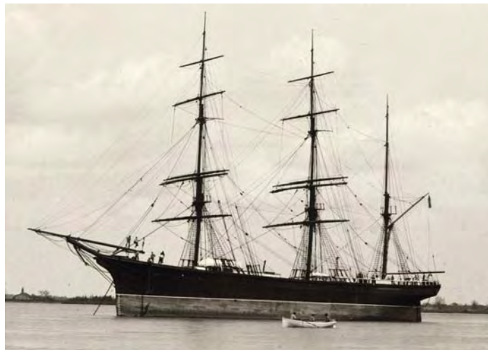
Bark Rosenberg på Mississippi i 1898