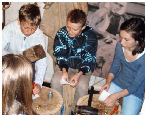
Elever fra Lassa skole 7A i sving med å slå maljer i seilmakerverkstedet