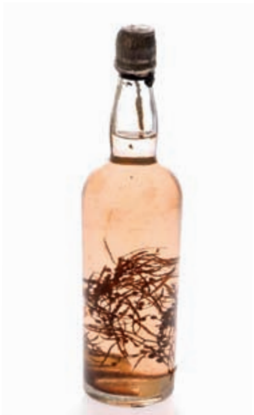
Tang fra Sargassohavet. (Museumsnummer STS.07162).

med opplysninger om givers forhold til gjenstandene, eller personlige beretninger av noe slag. De ble stående som et slags kollektivt vitnemål om at sjøfolk hadde reist hele verden rundt og tatt med seg kuriøse gjenstander. Museumssamlingen likner på tilsvarende samlinger i andre sjøfartsmuseer. Som regel stilles slike suvenirer ut enten som interiørelement i rekonstruerte sjømanns- og fiskerhjem, eller i egne montre med kuriosa i tilknytning til temaet handelssjøfart. Svært sjelden er det knyttet utfyllende opplysninger om opphavssted, kultur møter i fremmede havner eller sjømannsfamiliens forhold til gjenstandene. Museet har heller ingen fotografier som viser hvordan gjenstandene ble vist eller brukt i sjømannshjemmene.