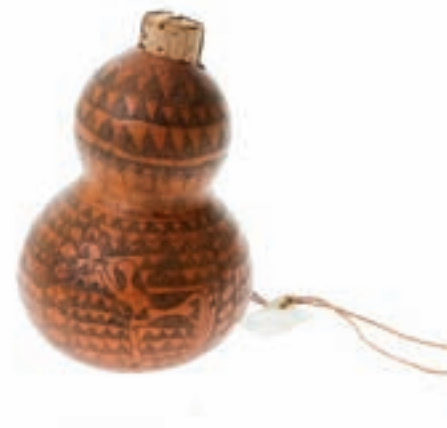
Suvenirer fra kaptein Rasmussens samling: En sjøkorall og en kalebass (ST-S.07158-F og ST-S.07158-G).