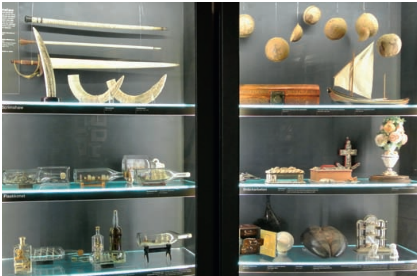
Et museumsmonter med sjømannsvenner ved Sjøfartsmuseet i Gøteborg.

De to donasjonene inneholder med andre ord liknende typer gjenstander som kommer fra samme region i Melanesia, samlet i samme tidsrom. Trolig er de samlet av samme person, men altså innlemmet i ulike museer med 35 års mellomrom. Begge samlingene er registrert med samme knapphet på opplysninger om giver og gjenstandens kontekst. I begge tilfeller er gjenstandene og samlingene som de tilhører nærmest gått i glemmeboken. Likevel er de tatt imot, men med to forskjellige perspektiv på gjenstandene som museums-