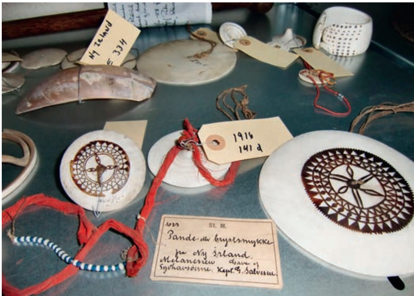
Fra Museum Stavangers magasin - gjenstander fra Melanesia som tilhører den etnografiske samlingen til Kulturhistorisk avdeling.

“What every museum displays, in one form or other, is the difference in interpretation. Interpretation is the relation between things and the words used to describe them, and this relation always involves a gap. Museums need not contain artefacts and need not contain text: sometimes interpretation is implecit and hidden. But without interpretation, without representing a relation between things and conseptual structures, an institution is not a museum, but a storehouse.” 5