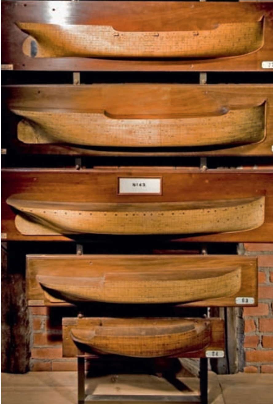
Halvmodeller fra Stavanger Støberi & Dok: Foto. Andreas Kleiberg/MUST