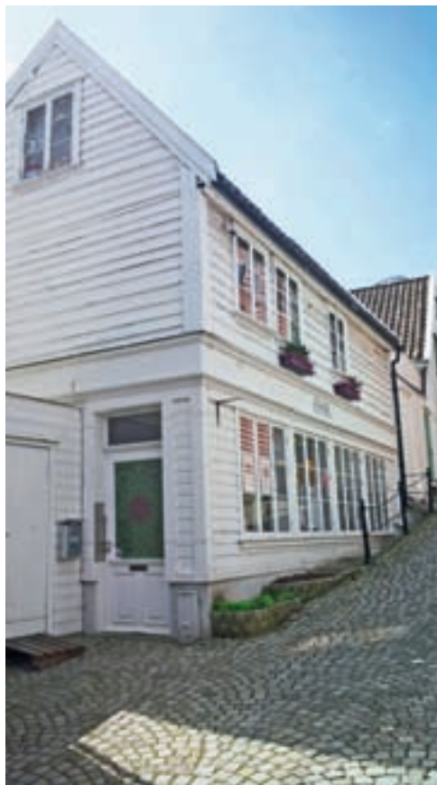
Høleberggata 11 slik bygningen ser ut i dag.

Andre norske museer som i dag har samlinger rundt trykkekunst og grafisk produksjon, er Sivert Aarflot museet i Volda som forvalter historien om folkeopplyseren og boktrykkeren Sivert Aarflot (1759-1817), og Pressemuseet Fjeld-Ljom på Røros som forvalter historien til lokalavisen Fjell-Ljom . I tillegg finnes det samlinger og utstillinger med utstyr fra trykkerier og grafisk industri i blant annet Norsk teknisk museum i Oslo, Vitensenteret Innlandet på Gjøvik og i Bergens tekniske museum. Bare Norsk grafisk museum har i dag trykkekunst og grafisk industri generelt som sitt hovedtema, og har vist seg å ha livets rett ut fra dette. Dette takket være en utrettelig innsats for både etablering og fortsatt drift fra tidligere byantikvarer, fagmiljøet og frivillige.