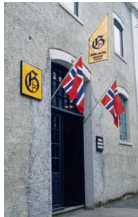
Den flotte utsikten fra Café Gutenberg ble under The Tall Ships´ Races i 1997 forskjønet av den russiske skuta «Kruzenshtern» som lå fortøyd her. Museet var åpent daglig, og hadde godt besøk.