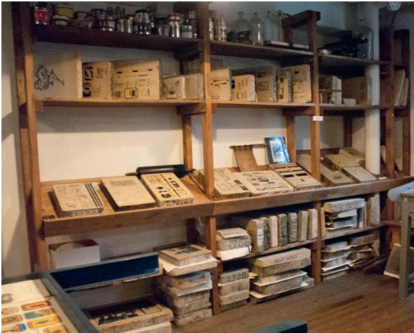
Litosteiner som ble brukt til å trykke blant annet iddiser og brevhoder. Fra utstillingen i Sandvigå 24.

Forslaget om et grafisk museum i Stavanger var godt begrunnet. Ser man bort fra Oslo-området, hadde Stavanger den absolutt største konsentrasjonen av grafisk industri i Norge. Industrien her vokste frem som sekundærindustri til den omfattende hermetikkindustrien fra slutten av 1800-tallet, med etiketter til hermetikkbokser som et hovedprodukt. Gjennom dette ble Stavanger-regionen ledende i Norge på litografisk produksjon og offset, og holdt toppnivå også i Europa. 3 I tillegg til etiketter ble det også trykt mengder