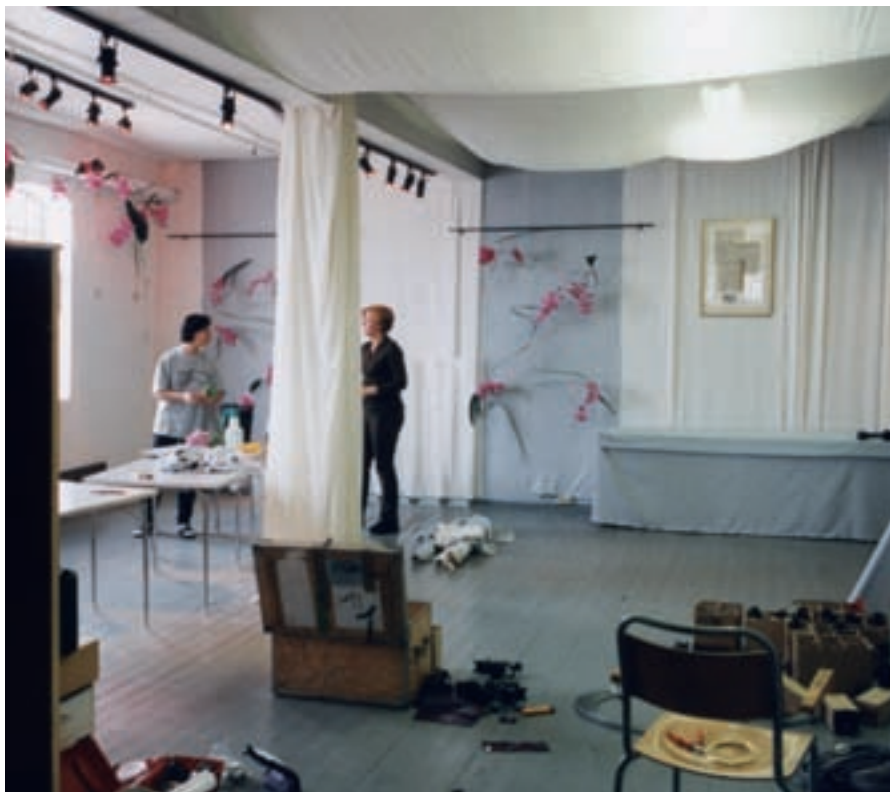
Café Gutenberg dekorerer til Chevrons verdenssamling (1998).

Arrangementer og selskaper for næringslivet ble en viktig inntektskilde i tillegg til støtte fra det offentlige og fra næringslivet, særlig i de første 10-12 årene. Både grafiske bedrifter og foreninger av ulike slag, annet næringsliv, veldedige organisasjoner, reiselivsaktører, private, samt museer, historielag og andre foreninger med historiebevaring og -formidling som arbeidsområde, har vært hyppige «leietakere» på museet. 103 Et av de største arrangementene