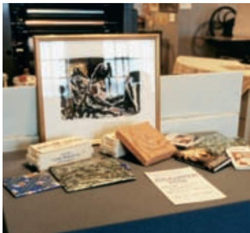
Premier til museets julelotteri 1996.

dermed var det liten mulighet for finansiering av driften av museet.