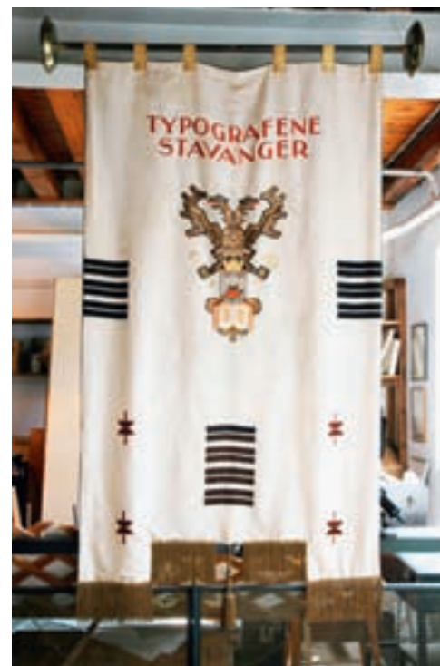
Fanen til Stavanger typografiske fagforening.