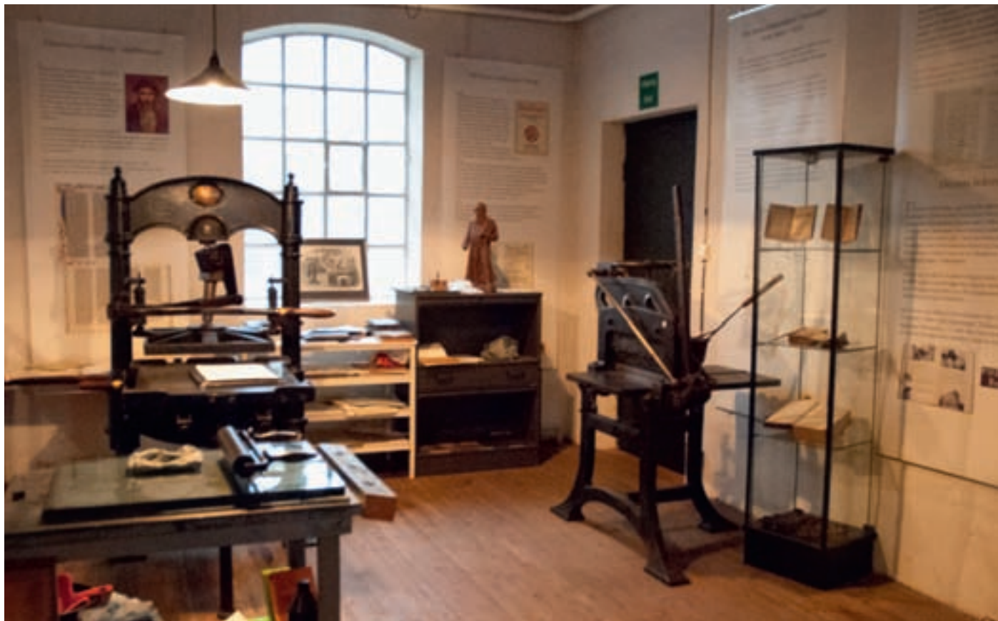
Boktrykkavdelingen i Norsk grafisk museum, med nye utstillingsbannere fra da utstillingen ble oppgradert i 2008.