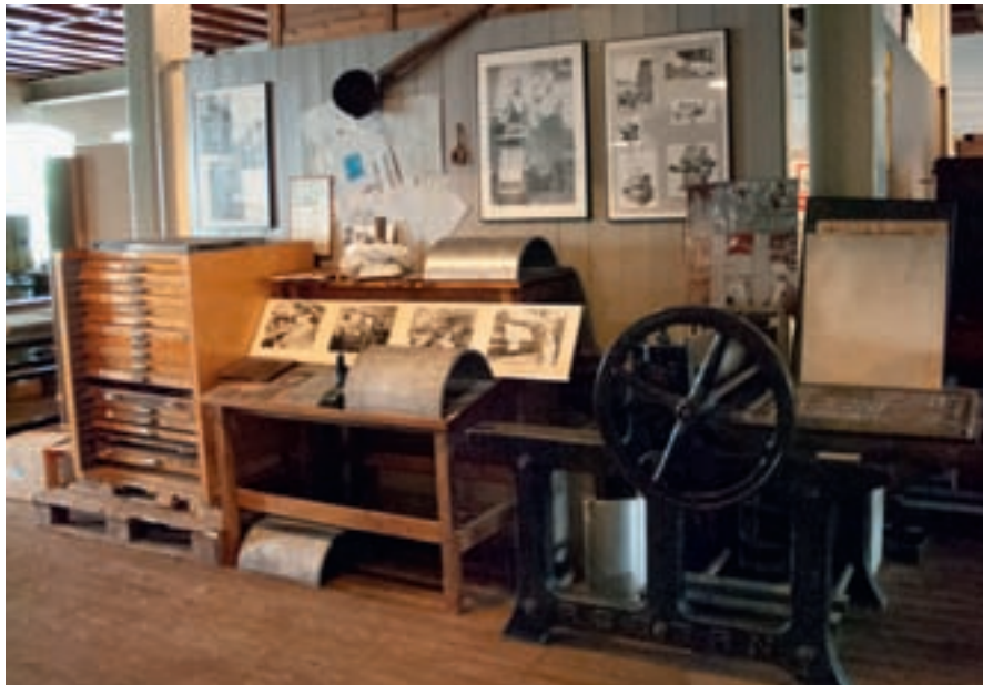
Klisjéanstalten i utstillingen i Sandvigå 24.