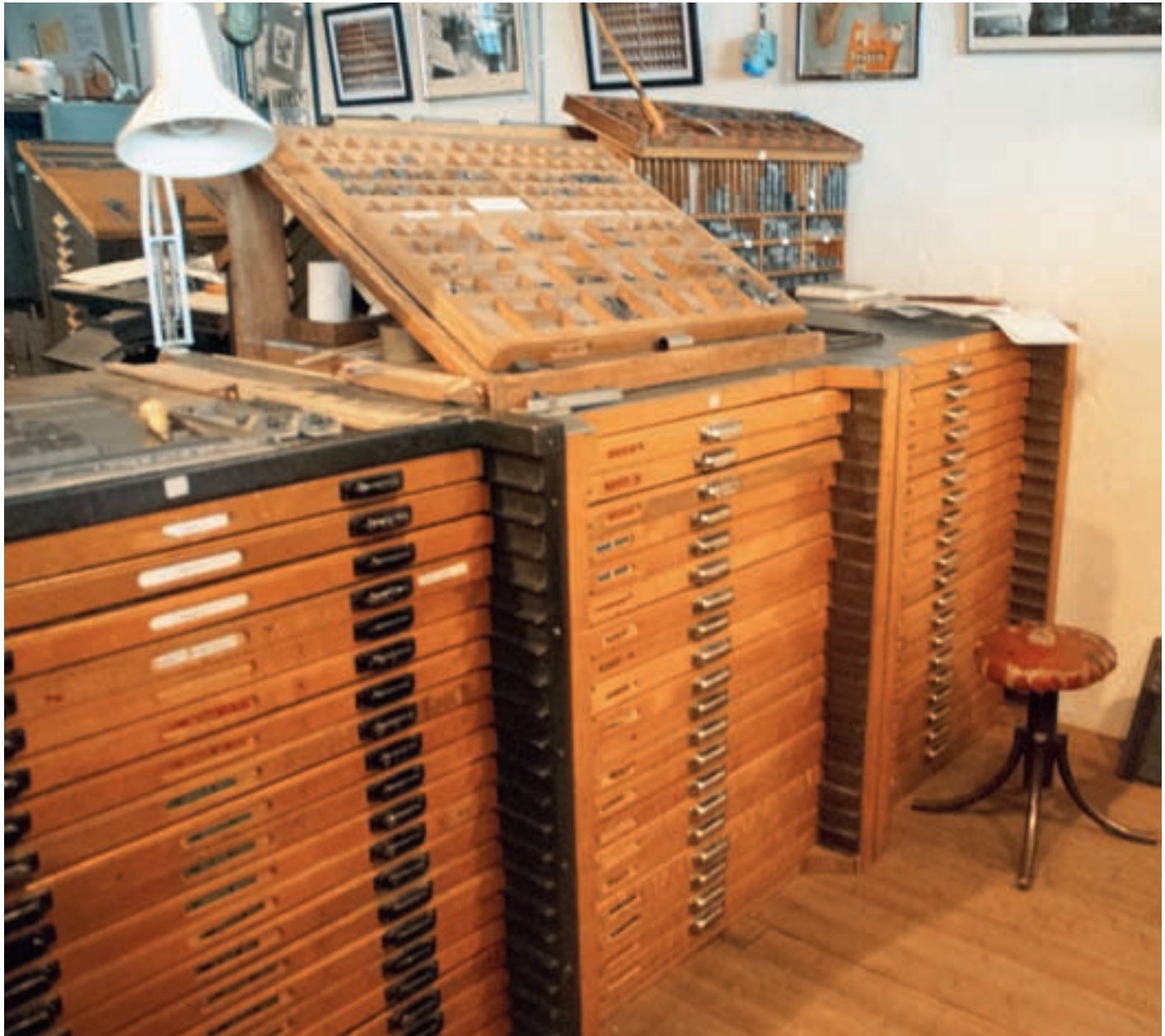
Fra håndsetteriet i museet.