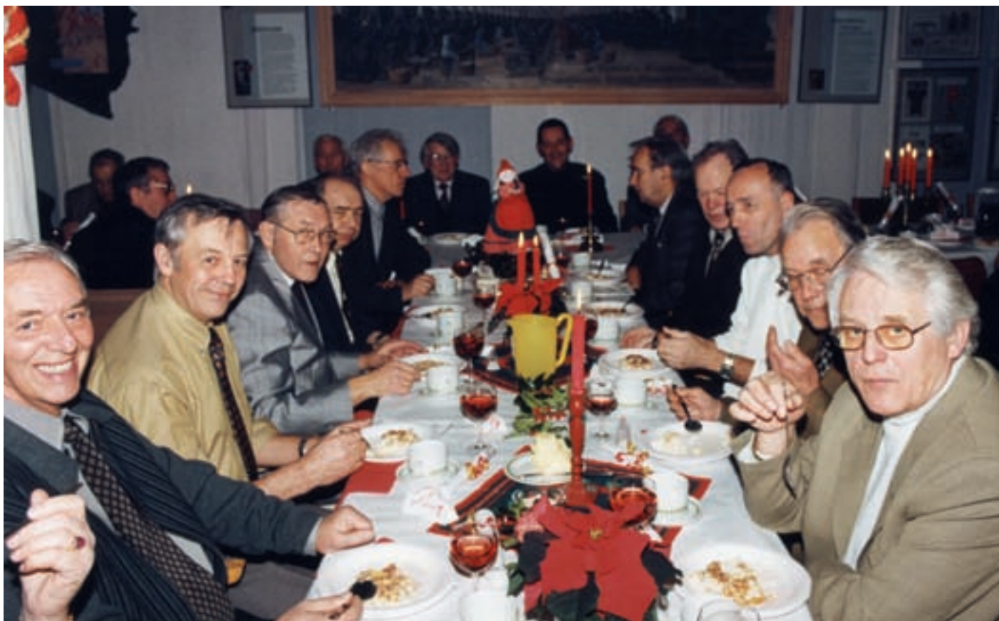
Fra et av de årlige julegrøt-arrangementene, hvor de som har jobbet frivillig gjennom året inviteres.

frivillige fra venneforeningen har stilt velvillig opp til omvisninger og demonstrasjoner av teknikker både i museets åpningstid og ved grupper og arrangementer utenom åpningstid. Grafisk museum har i alle år hatt kun en 50 prosent fast stilling, og den frivillige innsatsen frem til konsolideringen med Stavanger Museum har tilsvart mellom ca. 1 og 1,5 årsverk i tillegg. Siden konsolideringen i 2006 har museet ikke ført timeregnskap for dugnadsinnsatsen, men med utgangspunkt i at en «hard kjerne» på rundt åtte personer i venneforeningens dugnadsgjeng har møttes så å si hver onsdag kl. 11-14, kan vi anta at den generelle dugnadsinnsatsen har ligget rundt 1000 timer årlig i 2006-2013. Noe av denne tiden har dugnadsgjengen brukt til egne trykkeoppdrag – for eksempel innbydelser og servietter til jubileer og andre begivenheter, der et håndverksprodukt av denne typen har satt prikken over i-en.