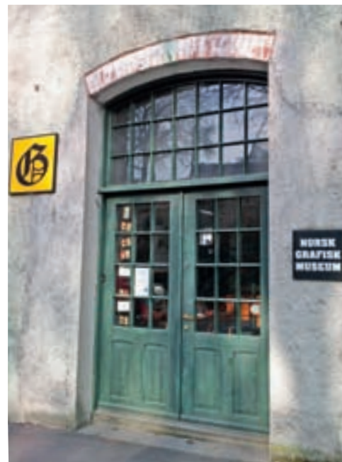
Inngangsdøren til Norsk grafisk museum i Sandvigå 24.

MUSEUM STAVANGER ÅRBOK, ÅRG.123 (2013), s. 8-69