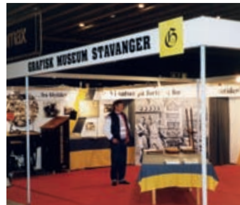
Fra Stavanger Grafiske Fagforenings stand på messen NORDGRAF i 1991, med slagordet «Vi satser på fortiden for fremtiden».