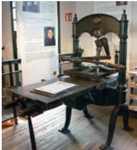
Manuell trykkpresse fra ca. 1850.