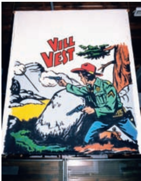
Utstillingsbanner for seriebladutstillingen med motiv fra seriebladet «Vill vest». Banneret var malt av daglig leder Alf Beckstrøm.