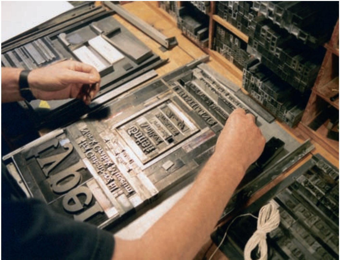
Setting av utstillingsplakaten til utstillingen «Typer fra Gutenberg til Norsk grafisk museum».