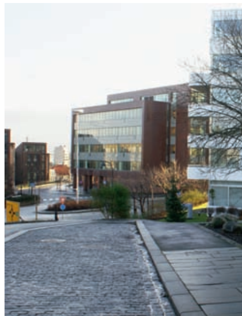
Peder S. Krøyers plass. Plassen skal skiltes i enden av Rosenberggaten når området opparbeides etter at SR-Banks konsernbygg er oppført på nabotomten. Plassen grenser til Storhaugstykket.