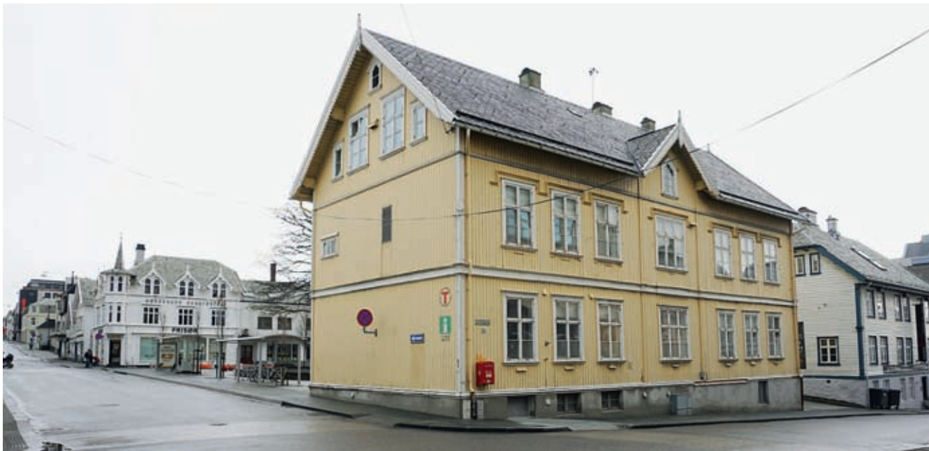
Skolen som lenge dominerte bybildet i Haugesund, sto ferdig 1860.