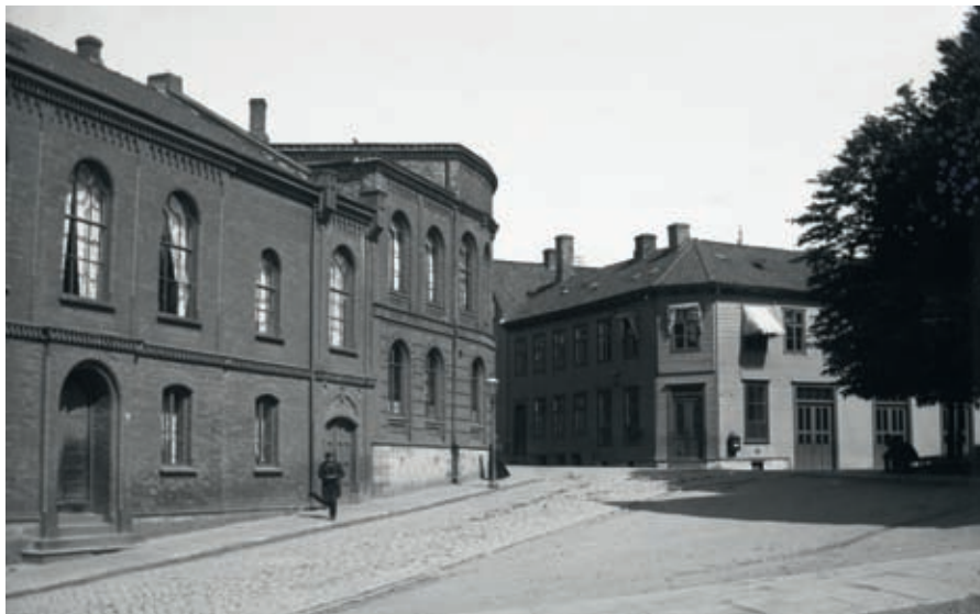
Sparebanken og fengselet, som begge ble tatt i bruk i 1865, bidro sterkt til å forandre bybildet ved Domkirken.

Vegg i vegg med banken, mot torget, ble fengselbygningen med rettslokale tatt i bruk samme år. Den enkle bygningen ble oppført med statlig støtte. Utgangspunktet skal ha vært Oslo-arkitektene A.F.W. von Hanno og H.E. Schirmers tegninger for fengselsbygninger som ble brukt en rekke steder i landet i perioden 1853-64, men von der Lippe har formgitt fasaden. Mot Domkirken ble Sparebankens fasade gjentatt i et sterkt forenklet formspråk. Fredrik von der Lippe har vært opptatt av å markere at dette er en ny, separat bygning. Veggfeltet nærmest banken hadde en tofløyet inngangsdør,