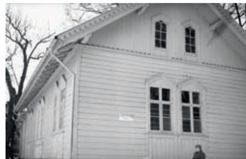
I 1862 fikk Kongsgård skole endelig sin gymnastikksal.

Den mest monumentale skolebygningen von der Lippe tegnet i Stavanger var Misjonsskolen på Kampen. Det norske misjonsselskap var dannet i 1842, og fikk hovedkontor i Stavanger. I 1846 ble Misjonsskolen etablert, og i 1864 sto det nye skolebygget ferdig. Med sine to fulle etasjer, beboelig loftsetasje og høy kjelleretasje, var bygningen ruvende. Men den var høyst nøkternt utformet. Så vel første som andre etasje var kledd med stående panel. Mellom etasjene var en markant gesimslist. Midtpartiet var lett fremhevet med en bred, dekorert gavl kronet av et solid kors. Gavlen, som har ranke-