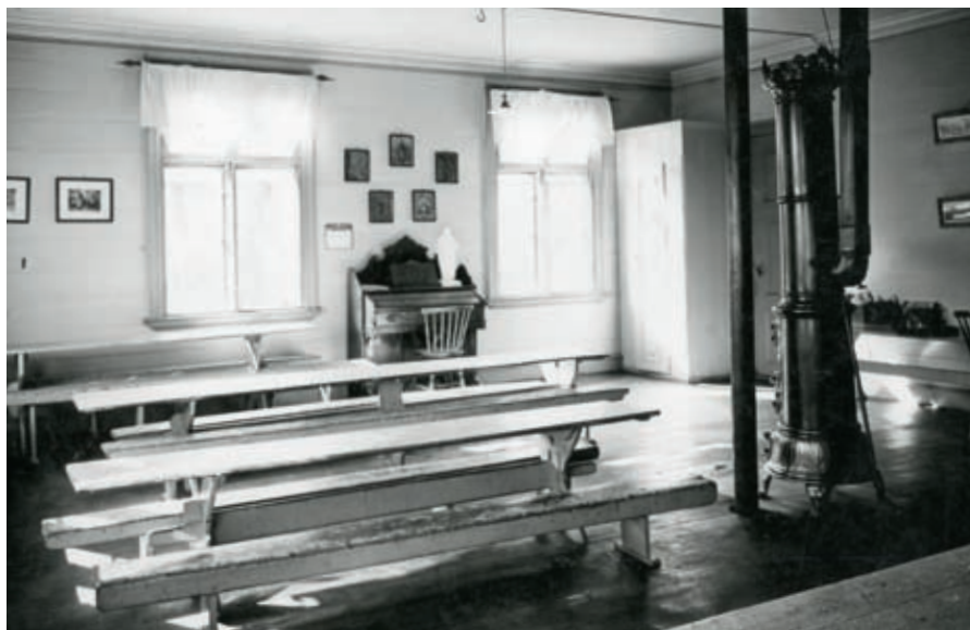
Oppholdsrommet i Domkirkens asyl i 1930-årene. Rommet hadde langbenker til mange barn, men ikke noe leketøy tilgjengelig for barna.

Ønsket om å gi barna en god barndom manifesterte seg også i det arkitekttegnete bygget på en 4 måls tomt som Domkirkens daghjem etter årelange innsamlingsaksjoner kunne ta i bruk 1959. 59 Her fikk 60 barn romslige lokaler og