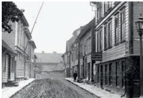
Asylgata 1898. Gaten har navn etter barneasylet, som lå på hjørnet ved Hospitalgata. Det har ikke vært mulig å finne noen tegning eller bilde av selve asylet. På bildet er asylbygningen allerede revet og St. Petri barneasyl flyttet til Lyder Sagens gate 9.

I 1960 – 1970 Daghjem og likestilling blir politikk skal vi beskrive debattene omkring kommunalt eierskap og den første nasjonale barnehagestreiken.