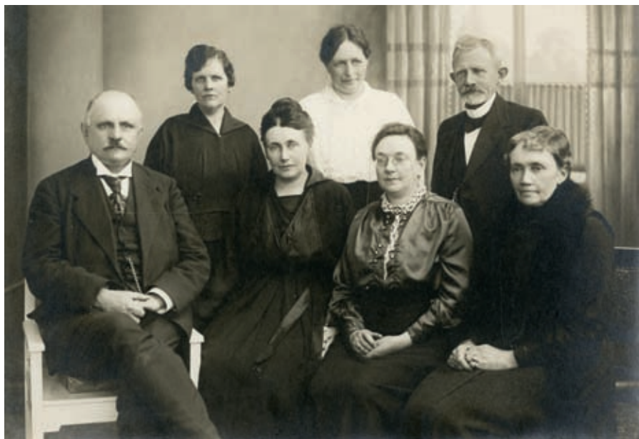
Bestyrelsen ved Domkirkens småbarnskrybbe 1919

Sitatet gir uttrykk for en stor grad av selvfølighet i forhold til arbeidet, uten rom for problematisering. Bestyrerinnen så på sin jobb som en mors-