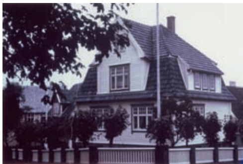
Lekeklassen for 6-åringer var et kvinnesforetak og hadde lokalene sine i barnehagelærerens privatbolig i Jørgen Moes gate 12. Det fantes flere 4 timers-barnehager som holdt til i barnehageeierens privathus.