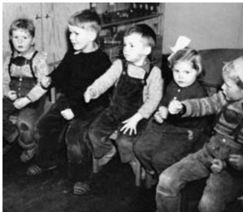
Samlingsstund i St. Petri daghjem ca. 1957. Samlingsstund var en del av dagsprogrammet der barnehagelæreren introduserte sanger, billedbøker, rim og regler eller noe som var typisk for årstiden. Barna satt i en ring som skulle symbolisere fellesskapet. Her ser vi barna syngende en sang med bevegelser.

Gruppebilde fra St. Petri daghjem ca. 1956. Barna er kledd i finklær. Bak dem åpne hyller med puslespill og annet utstyr tilgjengelig i barnehøyde. Videre en avskjermet lesestol der bøkene er oppstilt slik at barna kan se forsiden. Veggene er utsmykket med bilder som personalet har laget.