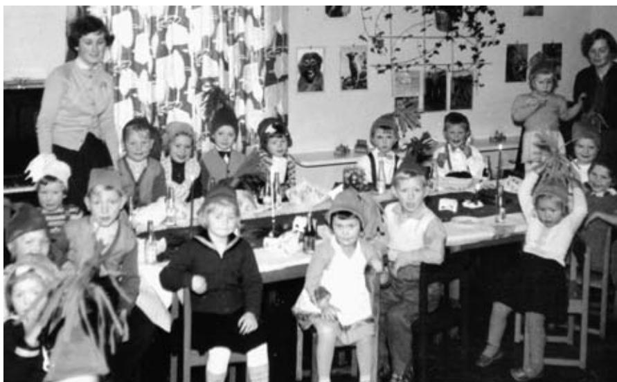
Fest i St. Petri daghjem ca. 1957. Daghjemmet skulle være et stedfortredende hjem, noe som gjenspeiles i veggpryd og gardiner. Legg merke til pianoet som kan skimtes til venstre i bildet. Pianospill var noe som ble etterspurt i stillingsannonser for barnehagelærere på 1950- og 1960-tallet.