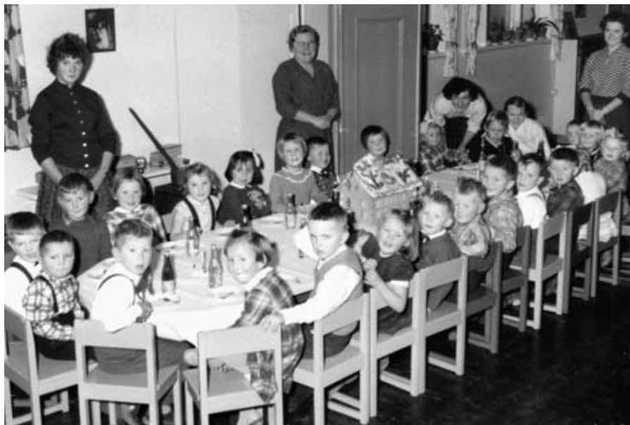
Juleselskap i St. Petri daghjem ca. 1957. Juletilstelninger med sang og gaveutdelinger har en lang tradisjon og er vel dokumentert gjennom hele asylperioden.

Det kirkelige aspektet fikk også en tydeligere markering i ansettelsesprosessen. For St. Petri dagheim ble det 1949 vedtatt nye grunnregler som fastslo at ansettelse av bestyrerinne og assistent nå skulle foretas av menighetsrådet og ikke lengre av institusjonens styre. Det ble krav om at "minst en av betjeningen bør ha full barnehagelærerutdannelse og de må begge være bekjennende kristne". 67 I stillingsannonser i 1914 og 1937 var det ikke stilt slike krav. Da sto det bare at bestyrerinneposten ved St. Petri asyl er ledig. I 1950 ble det søkt etter "fullt utdannet, troende barnehagelærerinne" til St.