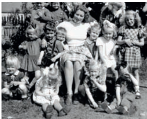
Dette gruppebildet fra Tante Bittens barnehage (1950-årene) viser det nære forholdet mellom «barnehagetanten» og barna. Hun skulle være barnas venn og lærer.