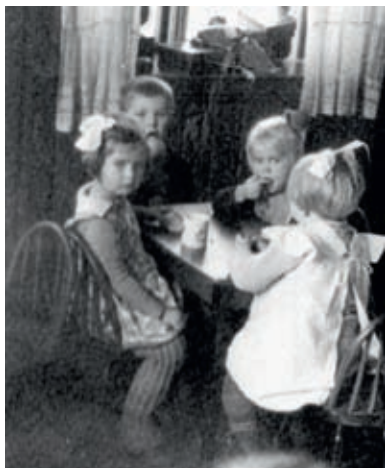
Måltid i barnehagen i Speiderhuset, Dronningensgate 12, tidlig i 1930-årene. Barna spiser i små grupper rundt bord i barnestørrelse.