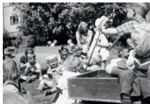
Utelek i Tante Bittens barnehage (1950-årene). Barnehagen var vel utstyrt med trehjulsykkle, vippe, disser, sandkasse, drakjerre, trøbil og trær til å klatre i.