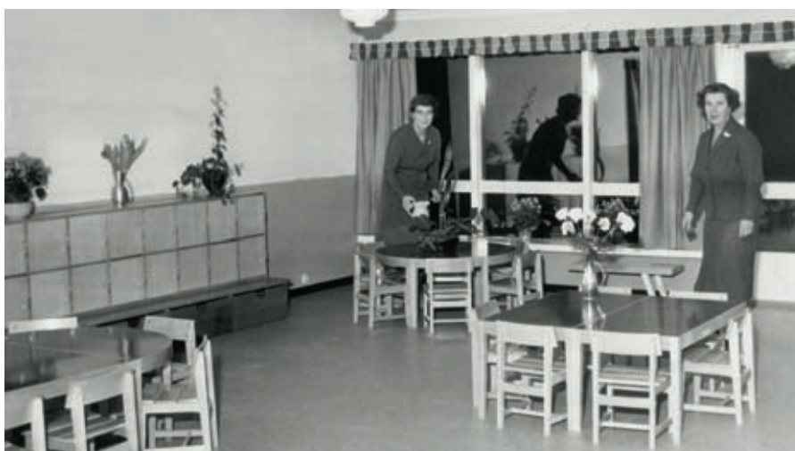
Domkirkens daghjem 1959. Asylet var blitt omformet til et moderne daghjem som i kvalitet var jevnbyrdig med Hjemmenes Vels barnehage. Etter mange års iherdig innsats og pengeinnsamling kunne menigheten tilby barna et nytt, romslig, arkitekttegnete bygg på en fire mål stor tomt i Chr. Thranes gate 30. Bygningene til Domkirkens barnehage og Hjemmenes vels barnehage er fortsatt i bruk som velfungerende barnehagebygg.