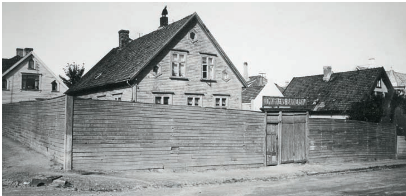
Domkirkens barneasyl i Henrik Steffens gate 7. Virksomheten foregikk bak høye gjerder uten innsyn. Asylet tok hånd om barn som hadde mødre som måtte arbeide for å livberge familien. Barna bodde nær asylet og det var vanlig at de gikk dit uten følge.

Vi var jo nysgjerrige og ville vite hvordan det var, og så spurte vi mor om få