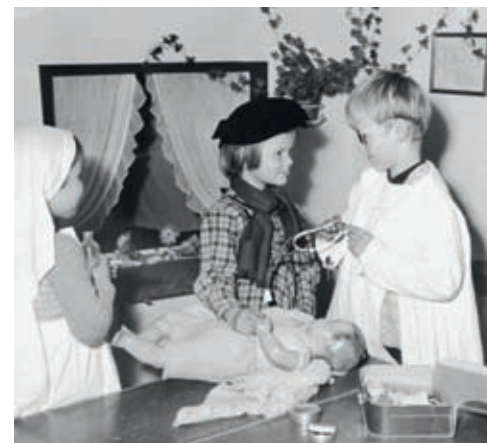
Doktorlek i Lekeklassen for 6-åringer i 1950-årene. Gutter og jenter skulle lære gjennom felles lek.

lige utredninger begynte man å dokumentere at det er sløsing med samfunnets ressurser når velutdannede kvinner ikke deltar i yrkeslivet. Dessuten var det bruk for kvinner i de nye velferdsyrkene i sykehus, sykehjem og lignende. Med andre bidro det stadig økende behovet for heldagsplasser til at kravet om utbygging ble satt på den politiske dagsorden. Så også i Stavanger.