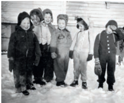
På tur med Tante Bittens barnehage i 1950-årene. Å oppleve naturens forandring gjennom årstidene var en viktig del av barnehagens og daghjemmets innhold. Det var derfor vanlig å dra på tur i nærmiljøet med hele gruppen.