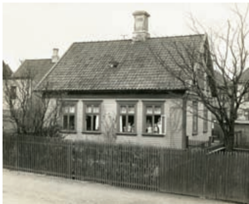
Domkirkens barnekrybbe, her fotografert i 1919, holdt til i dette huset i Klinkenberggata 23 fra 1910 til 2010. I første etasje var det to rom til de små barna, mens personalet bodde i andre etasje. Mødrene leverte barna sine ved døren før de gikk til arbeid på fabrikkene.

Stavangers voksende hermetikkindustri hadde behov for mer kvinnelig arbeidskraft. Dermed ble flere mødre beskjeftiget i fabrikkene. Problemet for mødrene var: Skulle de låse spedbarna inn hjemme uten tilsyn eller ta dem med i fabrikk? Fabrikken var også et farlig sted for krabbende eller stabbede småbarn. Det var behov for en institusjon som kunne ta vare på de yngste barna mens mødrene var i fabrikk.