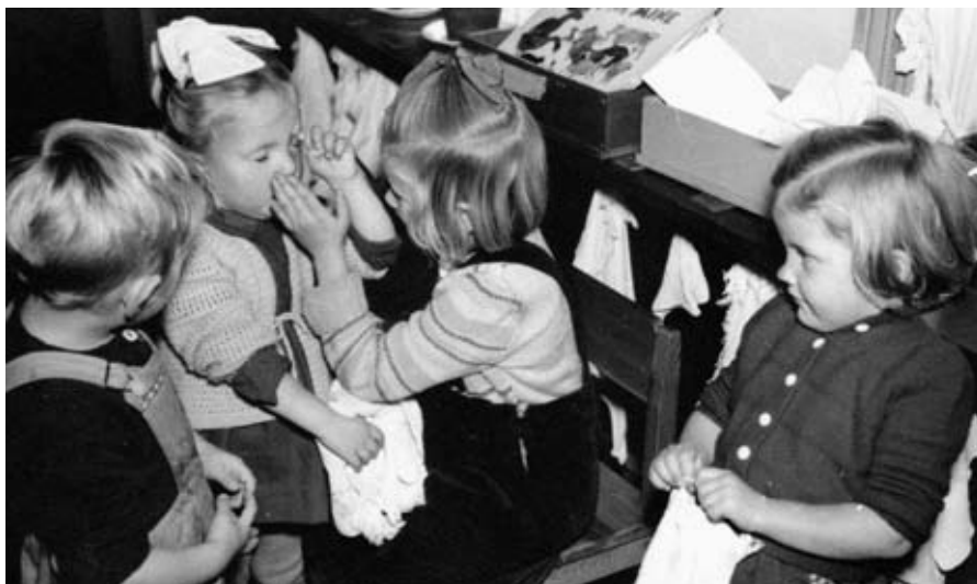
Barn som trøster hverandre i St. Petri daghjem ca. 1956. Det ble lagt vekt på at barna skulle lære å omgås andre, bli hjelpsomme og selvstendige. Derfor ble også håndvask og påkledning sett som lærings situasjoner.

I statuttene fantes det nå mer eksplisitte formuleringer om "kristelig oppdragelse", at daghjemmet skal være en "god kristen heim", preget av en "kristen ånd". 53 Denne presiseringen kan tolkes som en manifestering av ei-