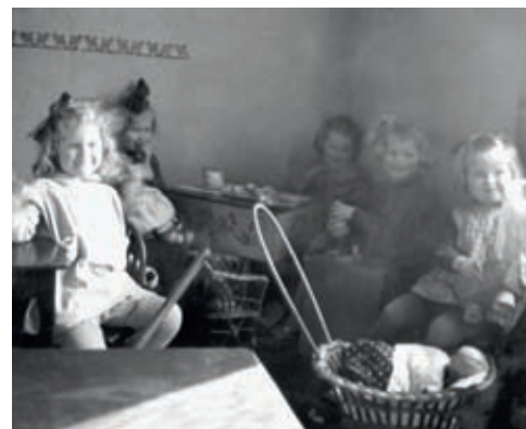
Dukke-krok i barnehagen i Speiderhuset, Dronningensgate 12 i 1930-årene, med koppestell, dukker, dukkevogner og møbler i barnestørrelse.

For denne jenta var barnehagen et sted med mange muligheter, der forholdene var lagt til rette for at barna kunne lykkes med det de gikk i gang med. I hvilken grad hennes opplevelse er representativ for flertallet, vet vi ikke.