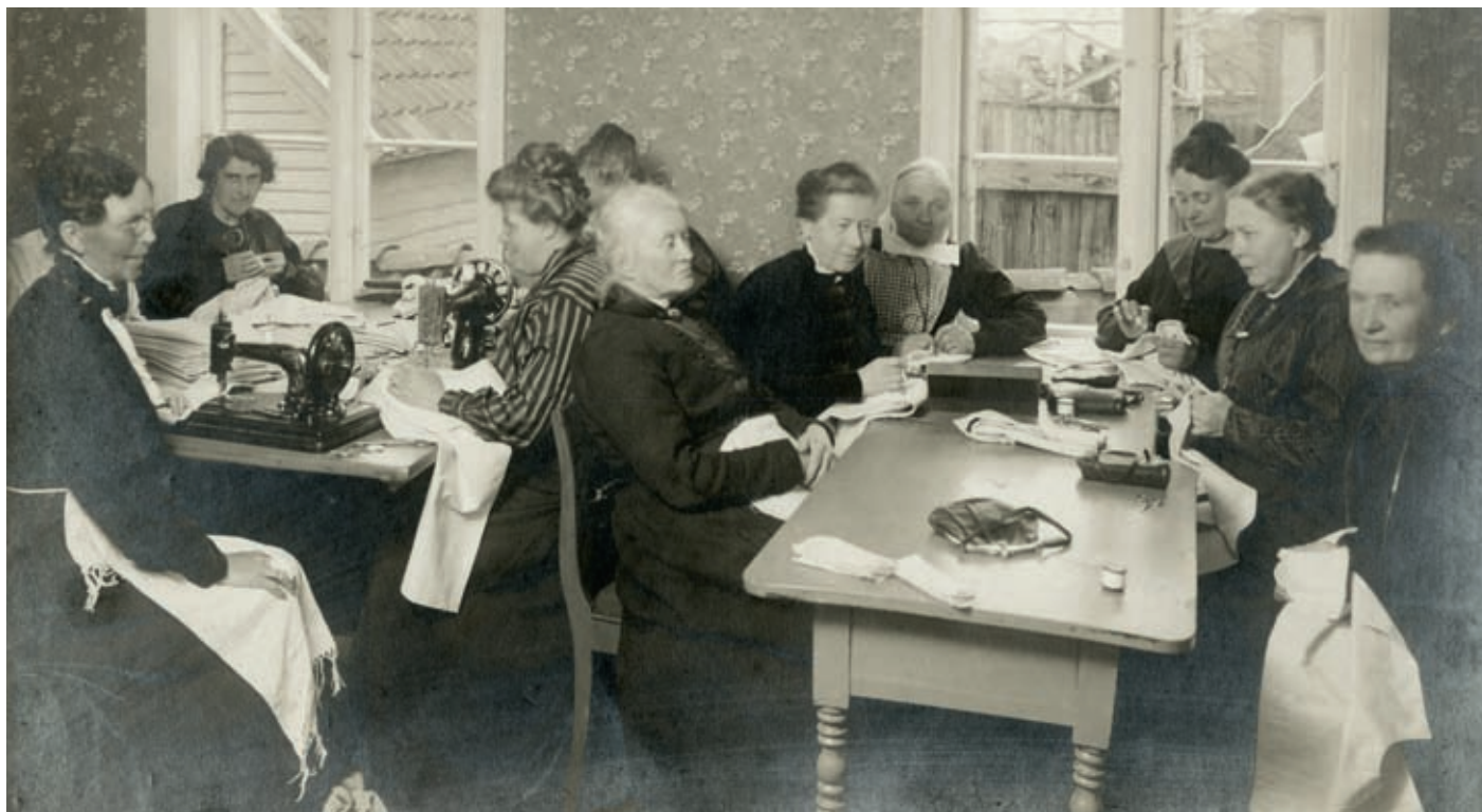
Syforeningen i Domkirkens barnekrybbe ca. 1946-1950. I alle asyl og barnekrybber ble det ved juletider delt ut klær som var laget av syforeninger. Slike veldedige gaver var vanlige helt fram til ca. 1950.

styrerinner ble etter mange års arbeid direkte overført som beboere til aldershjem. En kan spørre seg på hvilken måte de har behandlet barna, når de etter sin virksomhet i asylet var så tappet for krefter at de ikke maktet å ta hånd om seg selv. Arbeidet ser ut til å ha vært psykisk og fysisk krevende. Det store ansvaret talte for å ansette voksne kvinner, men samtidig var det behov for en kroppslig styrke som vanligvis kjennetegner yngre mennesker. En av informantene som arbeidet som medhjelper i en barnekrybbe rundt 1935 og