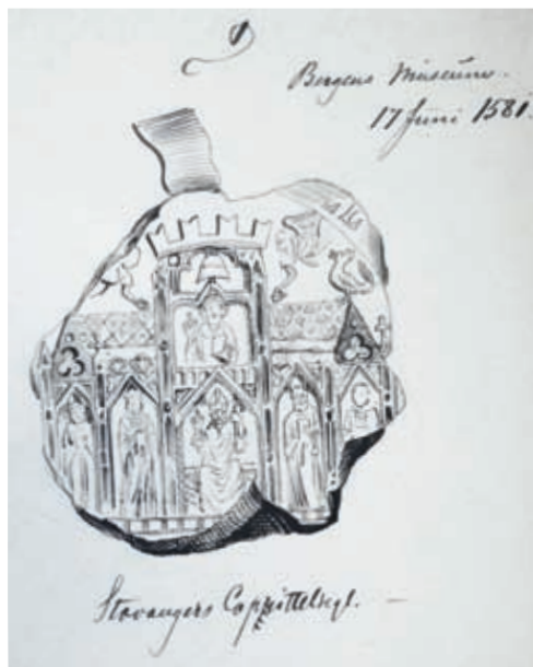
Figur 6 Tegning av den bevarte delen av domkapitelets segl under dokumentet fra 17.6.1581 om Krikens plass. Tegningen er i NRA, Norsk Historisk kjeldeskriftinstitutt, Segltekningar, i boksen «Kyrkjelege segl B». Det framgår ikke hvem som har laget tegningen.

Dokumentet er publisert i Marcus-databasen: 17.6.1581 – UiB: 1581, St. Botolfs Dag (17. juni) Stavanger kunngjøring; (byggetillatelse), – «... liggendis paa Samme Krikens platz neden for gaden imellem...». Seglmerket er kjent i flere avtrykk og avtegninger, der det eldste med samme motiv er fra 1319. En annen versjon av avtrykket fra seglstampen er gjengitt i SMÅ, 2015, side 202.