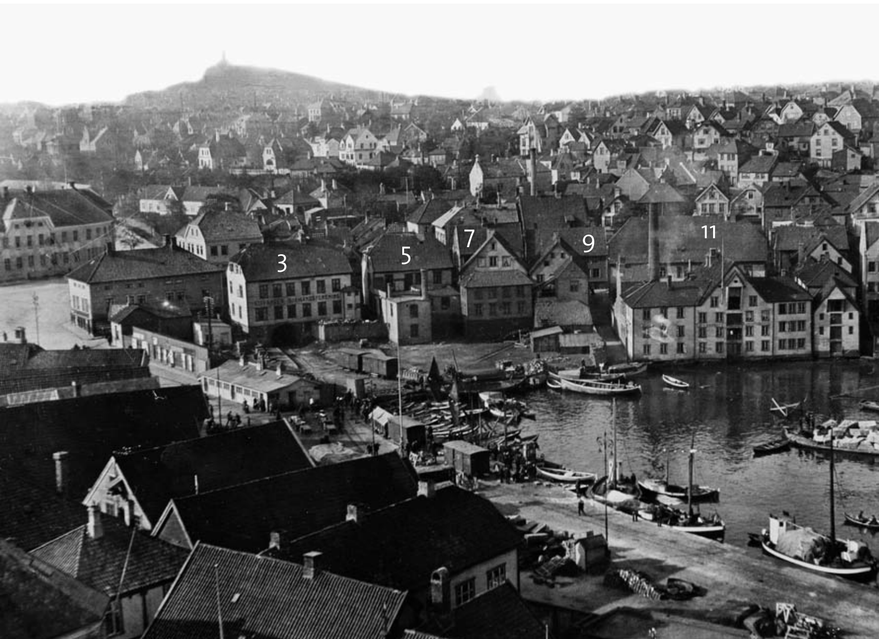
Figur 10 Nedre Strandgate 3, 5, 7, 9 og 11 (Rosenkildehuset) sett fra Valberget om lag 1920. Kriken omfattet nummer 3, 5 og 7, husene foran og noen av husene på baksiden.