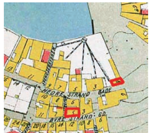
Figur 3 Dampbakeriet er avmerket ved 8-tallet (Torget 8), ved inngangen til Torget fra Nedre Strandgate. Øvre Strandgate 5 er også angitt med rød farge. Jernbanetunellen gikk gjennom Nedre Strandgate 3, der togsinnene er markert. De røde fargene angir funnsteder for kleberstein. Utsnitt av Stavanger kommunes bykart fra 1911, i Stavanger Museum.