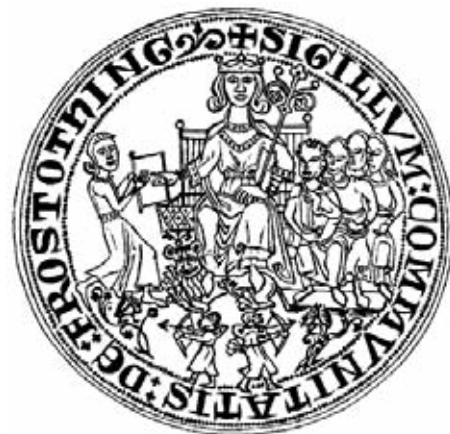
Frostatingsseglet viser Kong Magnus Lagabøter som gjev Landslova til lagmannen på Frostating. Det skjer på Botolvsmesse (det var på Gulating at lagtinget møtte til Jonssok).

Torvingsregelen i Frostatingslova var ikkje vidareført i Landslova. Men regelen om at ein kunne pryla småtjuvar vart derimot delvis vidareført. Etter Landslova var ordninga slik at ein primært skulle betala bot for slike småtjuveri, men måtte akseptera ein omgang juling om ein ikkje hadde noko å betala med. 20 Den store endringa var likevel at no gjaldt regelen bare for dei som kunne ta seg arbeid for å fø seg sjølv. For etter Landslova var det ikkje tjuveri om den som stal ikkje kunne få seg arbeid, og stal mat for å berga