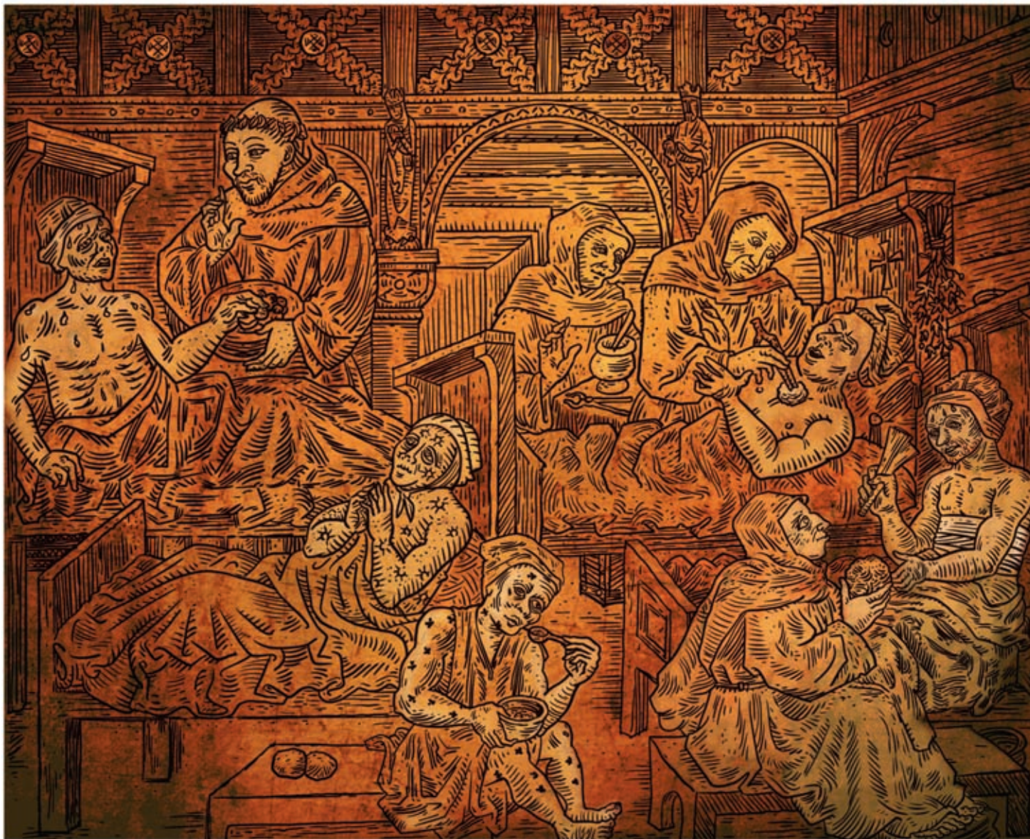
På hospitalet som Magnus Lagabøte gav til Stavanger ble mange syke og fattige tatt vare på. Her er ein kunstnerisk framstilling av korleis det kan ha vært.