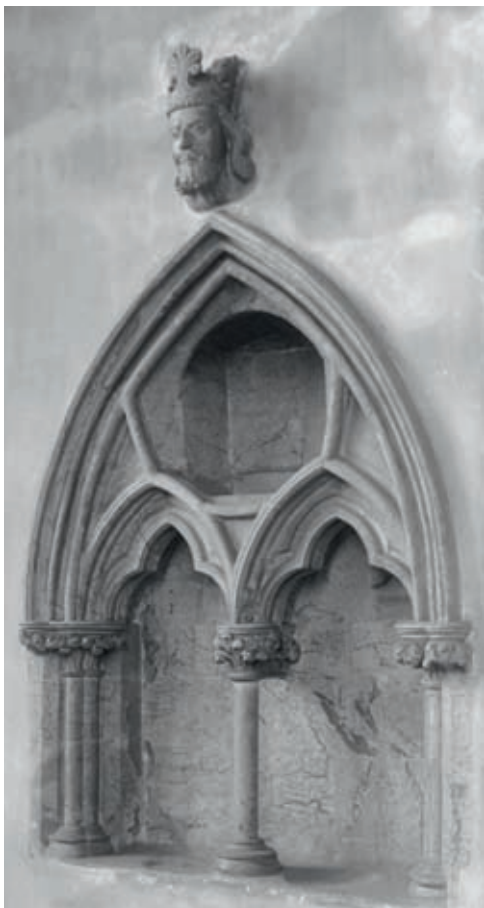
Nisje i koret i Stavanger domkirke med kongehode over. Hodet skal framstille Magnus Lagabøter.