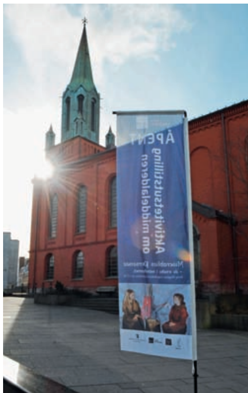
St. Petri kyrkje.

Reglane for botebetaling var bare ein del av samfunnsstrukturen og –aktivitetane som ættestrukturane hadde vore grunnleggjande for. Ein annan del var fattigomsorga. Kvar ætt tok vare på sine egne, og når ætta ikkje lenger fylte denne oppgåva, måtte det lagast strukturar slik at dei fattige ikkje vart overlate til seg sjølv. Ordninga som Håkon IV innførte gjekk ut på at alle i eit bygdslag skulle ha dei fattige buande hos seg i ein periode før dei vart flytta vidare. Vi finn ordninga referert til i det som er kalla Håkon Håkonssons nye lov. Den lova stammer frå om lag 1260, men er ei samling reglar som i alle høve skriv seg tilbake til om lag 1240, og kanskje enno eldre. I Magnus VI Lagabøter si Landslova frå 1274 vart denne fattigflyttingsordninga vidareutvikla til slik vi møter den i 1260. 14 Grunnstrukturen for fattigflyttinga ser ut til å ha vore bodstikkeruta, slik at fattige vart flytta etter same mønster som ein transporterte bodstikka. Den ordninga vart seinare kjent som legdsordninga, stod ved lag like til byrjinga av 1900-talet, og var altså i nesten 700 år kjernen i norsk fattigomsorg.