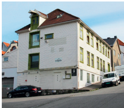
Kvekerskolen i Store Skippergate fra 1867, ombygd i 1878, nedlagt i 1912.