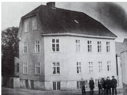
Det første fotografi av Kvekernes forsamlingshus i Hospitalsgaten 12, bygd 1852, revet 1957. Foto: Backhouse-familien, trolig fra 1869. Kvekerarkivet.