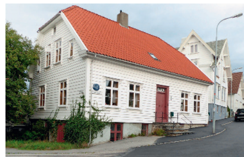
Til venstre: Peder Fugellis hus og sydvestfabrikk, bygd 1868, Kvitsøygaten 18.