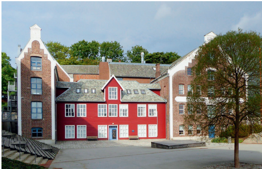
Kvekeres forsamlingslokaler i Sandvigå 7, Bjergsted fra 1993, toppetasjen i trehuset. (Foto: heaa).

Den viktigste aktiviteten er de ukentlige stille andaktsmøtene. Som opptakt til 200-årsjubileet er det gjort en innsats for å ordne arkiv og boksamling samt å rehabilitere lokalene i Sandvigå 7. Sammen med Stavanger kommune er det gjennomført et stort arbeid på gravstedet i Øvre Haukeligate.