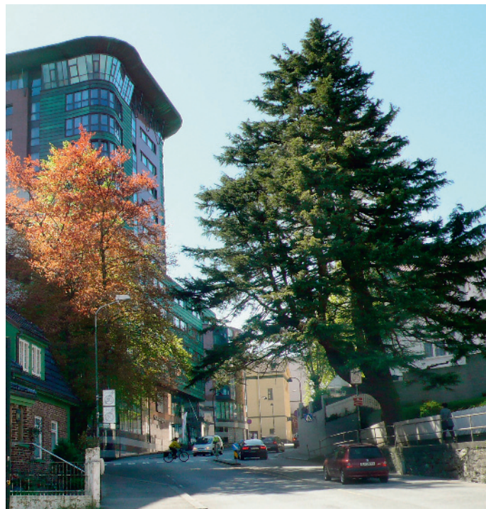
The Lebanon Cedar, imported from England in 1857; a symbol of the history of Quakerism in Stavanger.

Today the Quaker Society in Stavanger is small, but has an obligation to take care of the history and the celebration of 200 years of history, as well as taking part in international and national Quaker activities. – The Lebanon cedar with its strength and vitality gives inspiration to future activities and engagement and reminds us of the history of the Quaker Society in Stavanger.