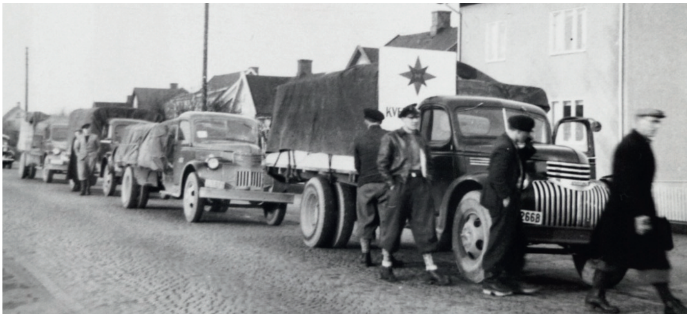
Kvekerhjelps lastebilkolonne til Hamburg 1947 (Foto: Privat eie, Bryne-familien).

Atomtrusselen på 1960-tallet førte til stor aktivitet blant kvekerne. Som et pasifistisk kirkesamfunn hadde kvekerne en lang tradisjon for fredsarbeid.