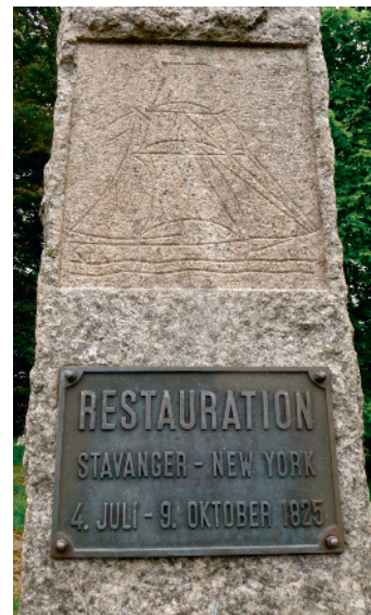
Utvandrermonumentet i Bjergsted. Reist ved 100-årsjubileet i 1925.

Kvekersamfunnet fikk etter hvert den styrken og utbredelsen som er omtalt i