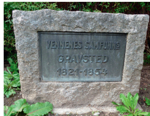
Kvekergravstedet mellom Muségaten 54 og 56. I bruk fra 1821 til 1854.