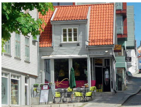
Asbjørn Klosters skole, Hetlandsgaten 2. Klasserommet/ene lå trolig bak huset med butikkvinduene. Dette huset ble revet da det moderne huset bak ble bygd.