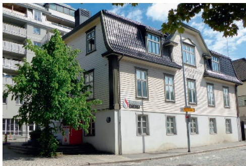
Stedet der Kvekersamfunnet ble stiftet 29. august 1818. Lars Larsen Geilanes gård lå her. Nå Kongsgaten 48-52.