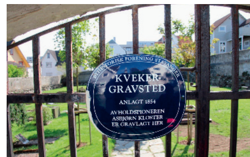
Gravstedet i Øvre Haukeligate 39.