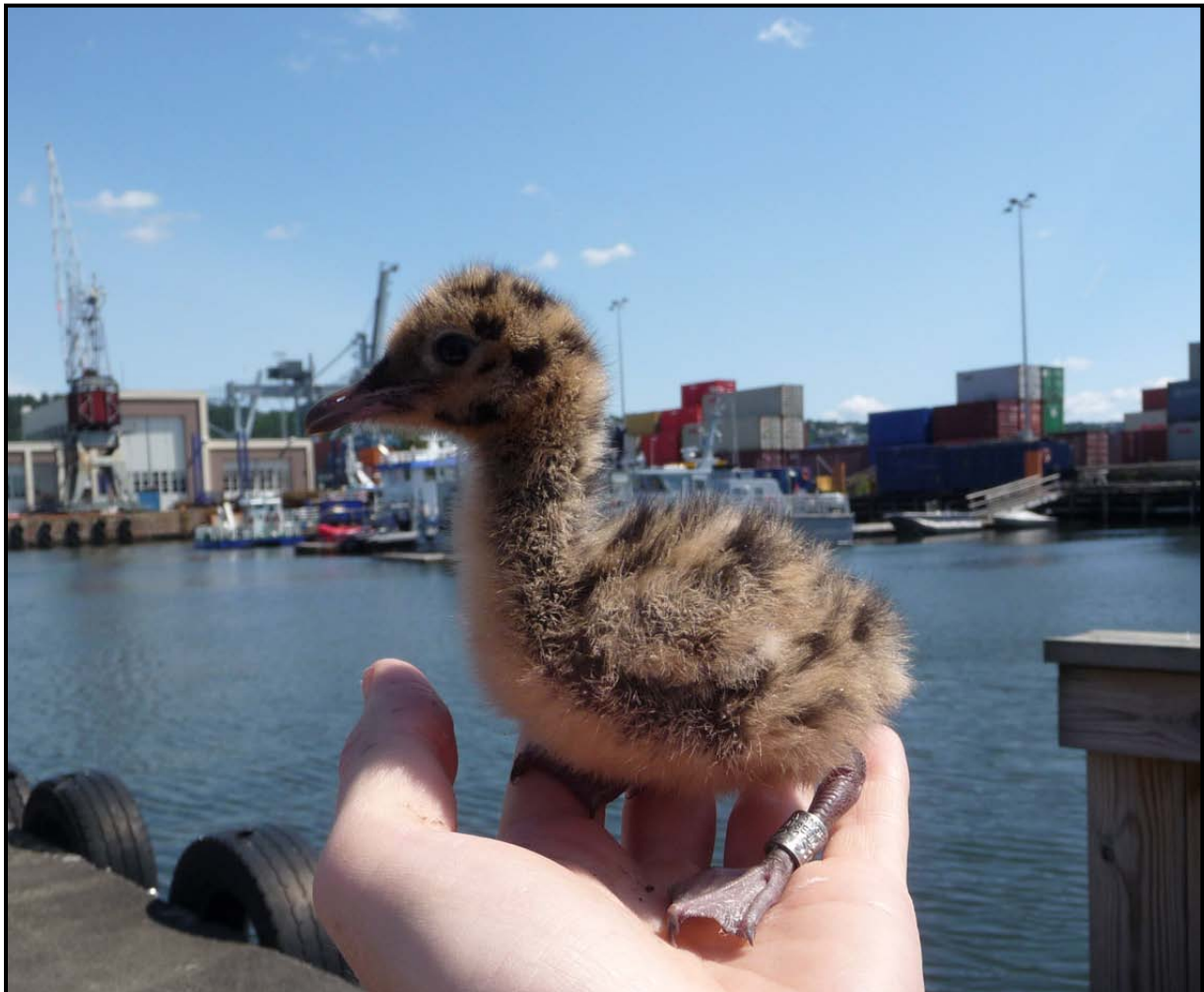
Figur 1. Hettemåker hekker også urbant, som her i Oslo havn. Sjursøya, 13.6.2011.

Takhekkende måker i Oslo er foreløpig dårlig kartlagt. Inntrykket er at det ikke er veldig utbredt. Så langt er det sildemåke og fiskemåke som bruker flate tak som hekkeplass. Det har ført til noen konflikter når de hekker på tak i boligområder. Det har så langt ikke vært satset spesielt på merking av disse, men et fiskemåkepar på Løren har fått ungene sine merket de siste tre årene.